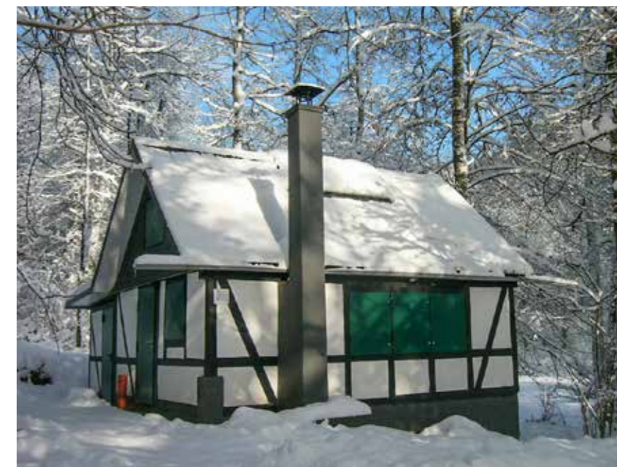
Die vom Verein „HadZmich“ in vielen Arbeitssunden liebevoll restaurierte Hütte bietet im Sommer wie im Winter ein malerischen Anblick.