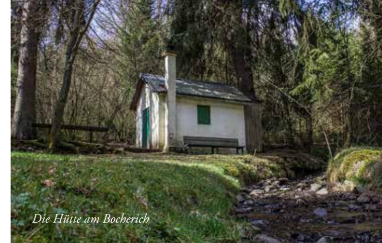
Die Hütte am Bocherich

einer sehr wechselvollen Geschichte. Wie sie weitergeht? Wir sind gespannt!